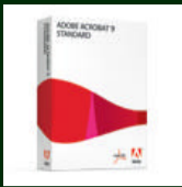
Adobe Acrobat 9 Standard