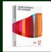
Adobe Acrobat 9 Pro Extended